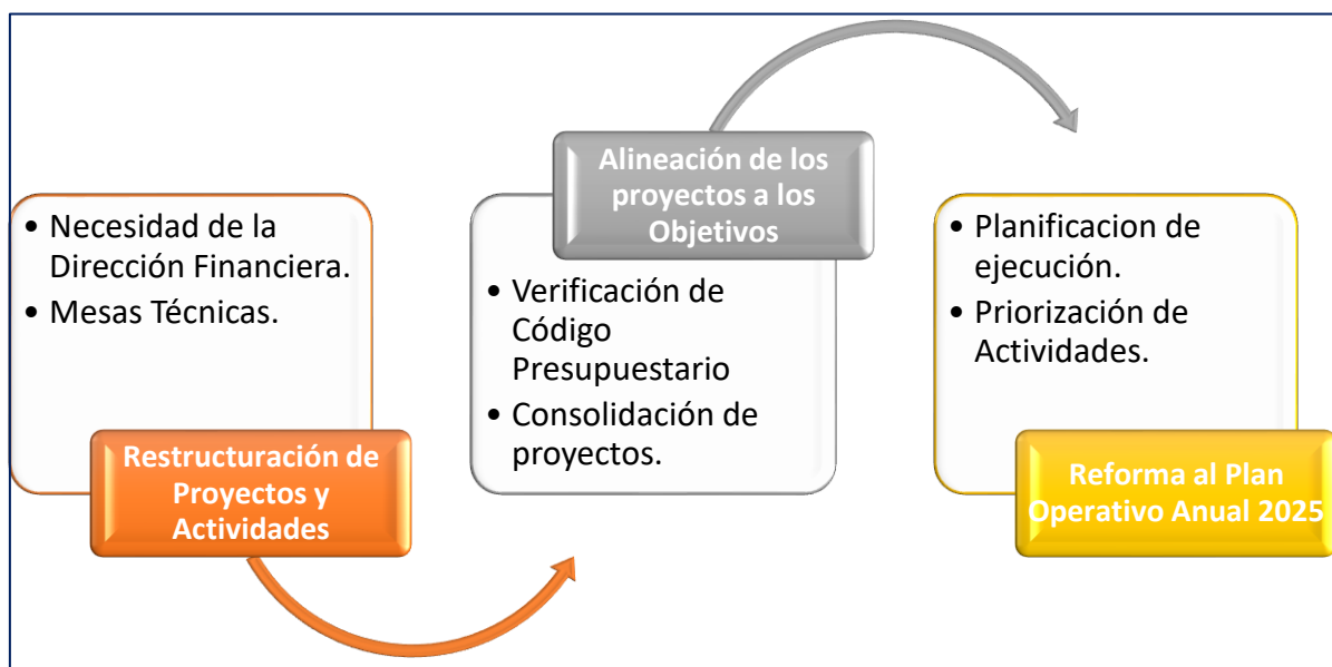
Ilustración 1: Metodología de Elaboración de la Reforma al Plan Operativo Anual 2025.

Elaborado por: Dirección de Planificación Estratégica y Procesos.